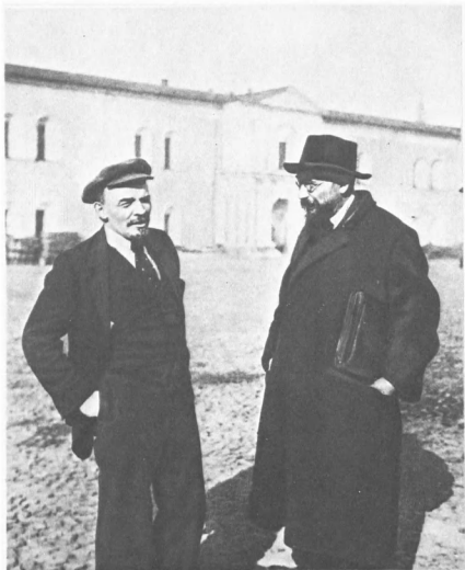
В. И. Ленин с В. Д. Бонч-Бруевичем во дворе Кремля на прогулке по выздоровлении после ранения. 16 октября 1918 г.