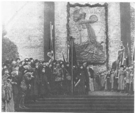
В. И. Ленин, Я. М. Свердлов на Красной площади у Кремлевской стены во время демонстрации трудящихся, посвященной 1-й годовщине Великой Октябрьской социалистической революции. 7 ноября 1918 г.