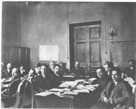
В. И. Ленин в Кремле на заседании Совета Народных Комиссаров. 17 октября 1918 г.