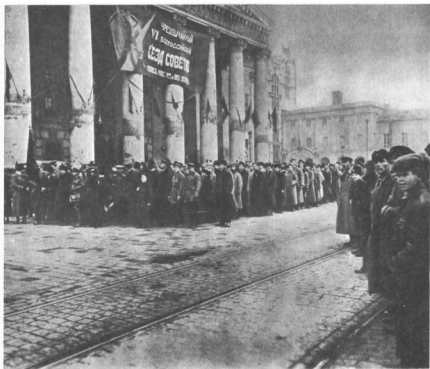
В. И. Ленин, Я. М. Свердлов во главе колонны делегатов VI Всероссийского Чрезвычайного съезда Советов у Большого театра; делегаты направляются на площадь Революции на открытие временного памятника К. Марксу и Ф. Энгельсу. 7 ноября 1918 г.