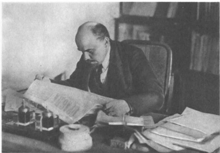
В. И. Ленин за рабочим столом в своем кабинете в Кремле. 16 октября 1918 г.