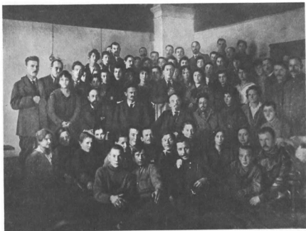
В. И. Ленин в группе работников секретариата Совнаркома в Кремле. Не ранее 17 октября 1918 г.