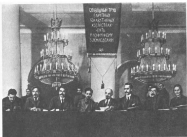
В. И. Ленин, Я. М. Свердлов в президиуме I Всероссийского съезда земельных отделов, комитетов бедноты и сельскохозяйственных коммун в Колонном зале Дома союзов. 11 декабря 1918 г.