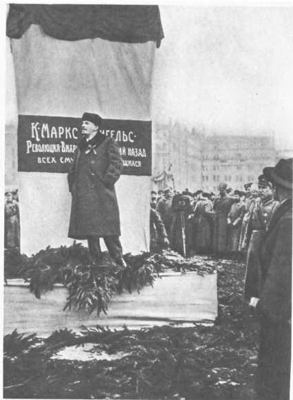
В. И. Ленин произносит речь на открытии временного памятника К. Марксу и Ф. Энгельсу на площади Революции. 7 ноября 1918 г.