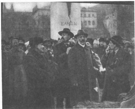
В. И. Ленин, Я. М. Свердлов на площади Революции перед открытием временного памятника К. Марксу и Ф. Энгельсу. 7 ноября 1918 г.