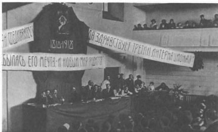
В. И. Ленин произносит речь перед участниками I Всероссийского съезда по просвещению в здании Высших женских курсов. 28 августа 1918 г.